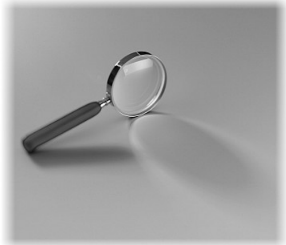
Weniger eigene IT-Aufwände dank Advanced Services.

Um rasch Ihre Service-Anforderungen zu erfüllen und zugleich Ihnen die Budgetkalkulation zu erleichtern, bieten wir diese Advanced Services auch in individuellen, attraktiven Rahmenkontingenten.