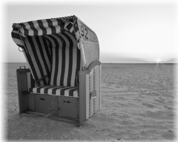
Beruhigt erholen: Keine Urlaubsengpässe mit AFI Business Process Outsourcing Services.

Daneben bieten wir auch den gegenteiligen Weg: Wenn gerade Urlaubszeit herrscht oder personelle Engpässe bestehen, so können Sie von AFI qualifiziertes Personal anfordern, dass bei Ihnen vor Ort hilft das Arbeitsaufkommen zu bewältigen.